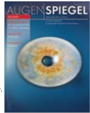
Titelbild: Perforierende Keratoplastik.